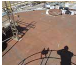
Prolongue la vida útil de sus activos protegiéndolos del ataque ambiental.

Belzona 5831 es más apto para aplicaciones en entornos de altas temperaturas, por ej., en climas tropicales.