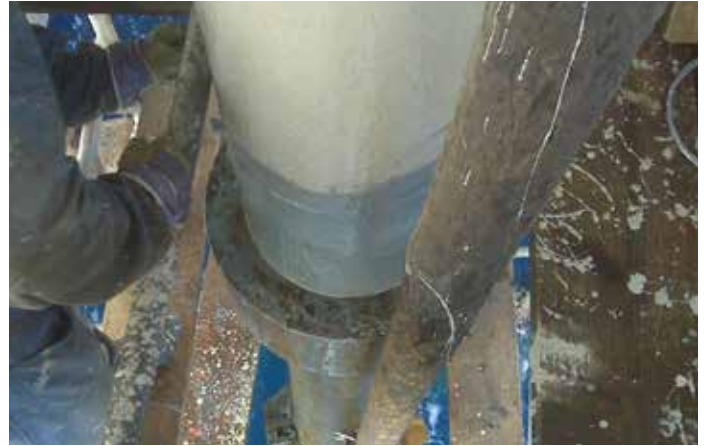
Belzona 5831LT es tolerante a la humedad e ideal para el uso en alta mar

Belzona 5831LT está disponible tanto en gris como en blanco, tonos fáciles de teñir a fin de conseguir otras opciones de colores.