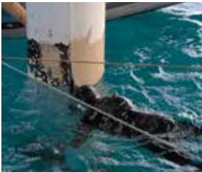
Proporciona protección contra la corrosión de larga duración en la zona de salpicadura.

Belzona 5831LT es más apto para aplicaciones en entornos de bajas temperaturas, por ej., las frías aguas de alta mar.